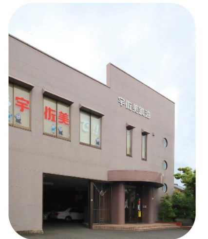
株式会社 西日本宇佐美