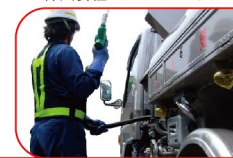
株式会社Go-toアサヒエナジー

本社 〒594-0071 大阪府和泉市府中町1-1-6 アルベロビルディングI 2階 TEL: 072-438-5333 FAX: 0725-43-6077