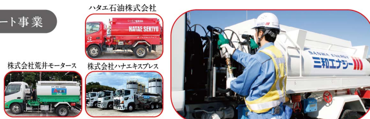
ハタエ石油株式会社

本社 〒222-0033 神奈川県横浜市港北区新横浜2-5-15 新横浜センタービル5階 TEL: 045-548-8838 FAX: 045-548-6638