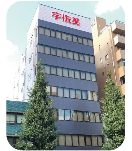
株式会社 東日本宇佐美