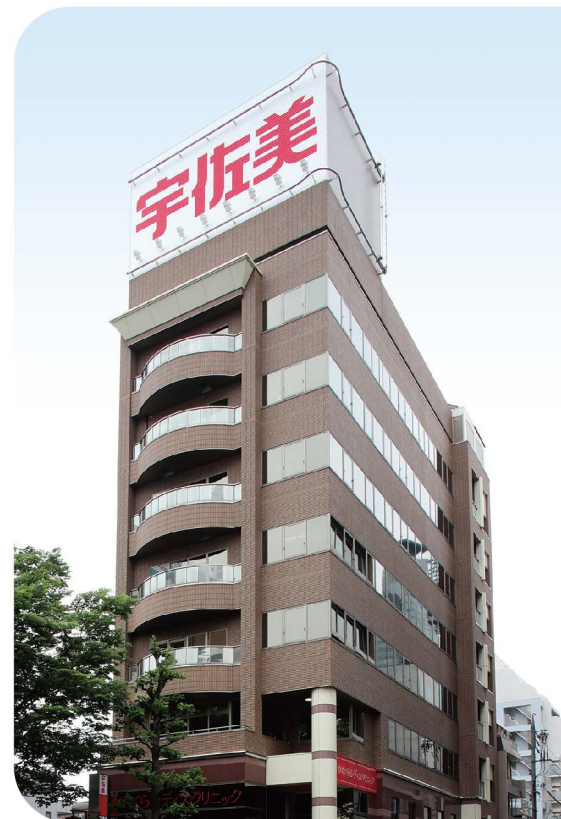
株式会社 宇佐美鉱油